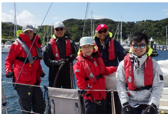
強風の中、ヴェラシスマリーナに到着