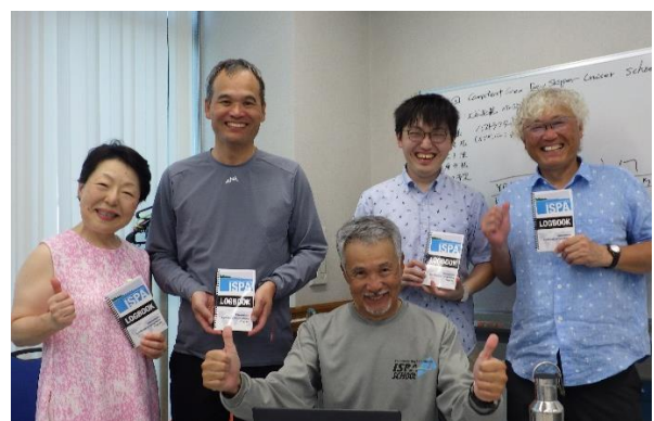
最終日のサーティフィケート授与式