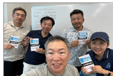
③ 修了式後の記念写真